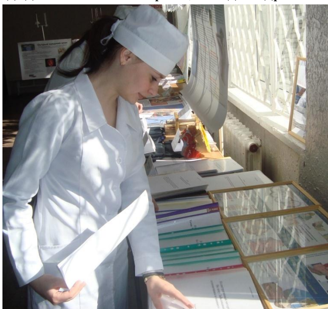
На фото: работа студенческого жюри выставки научно-технического творчества.