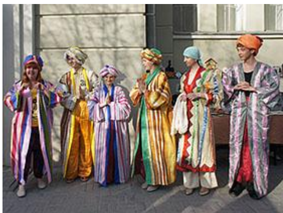
На фото: Персонажи «Тысячи и одной ночи».